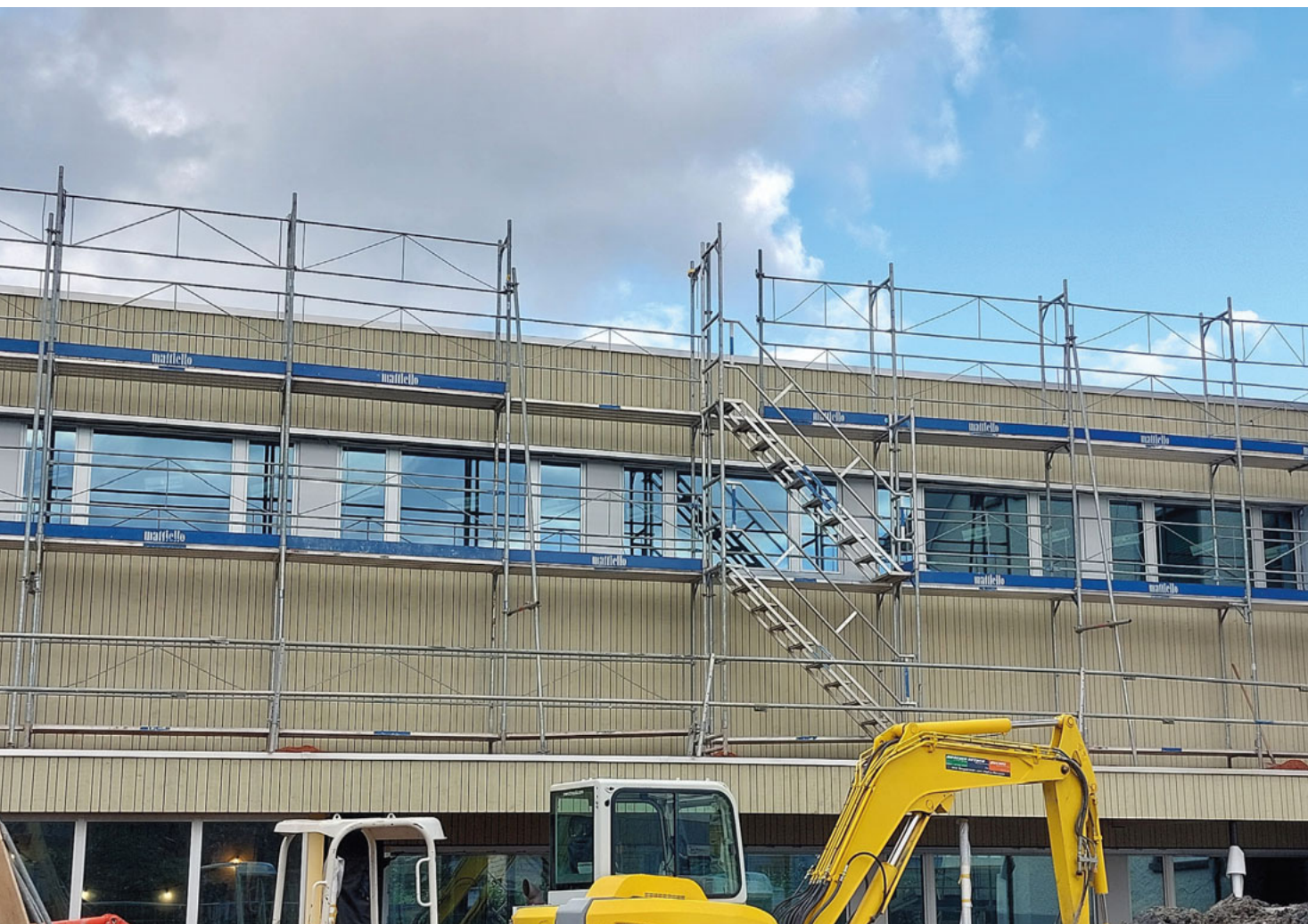
Neubau Zwischentrakt OZO, Ansicht Süd