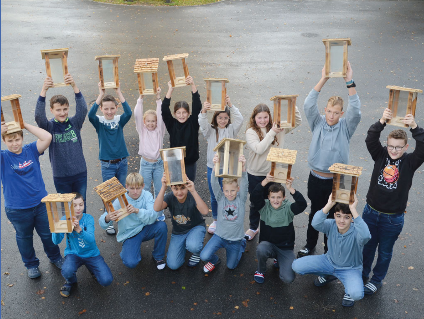
Klasse 1ra OZM mit Laternen