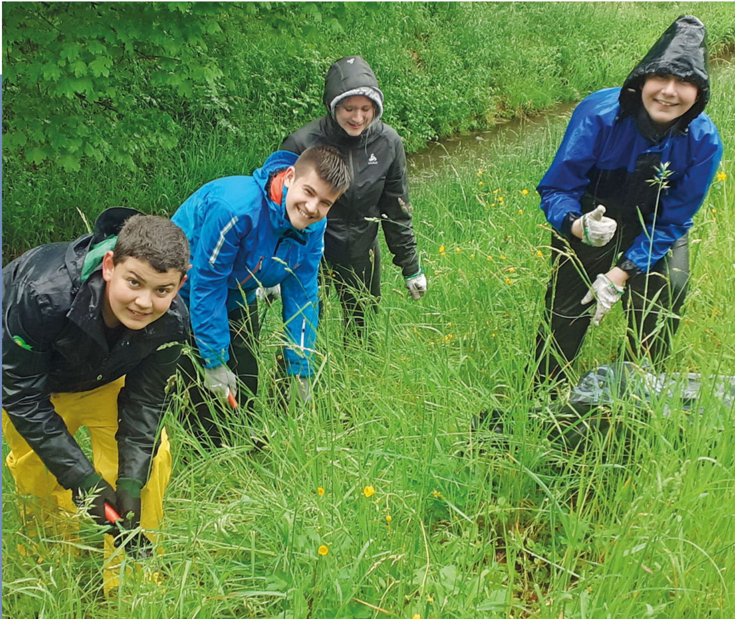
Neophyteneinsatz – 1. Sekundarklasse OZM