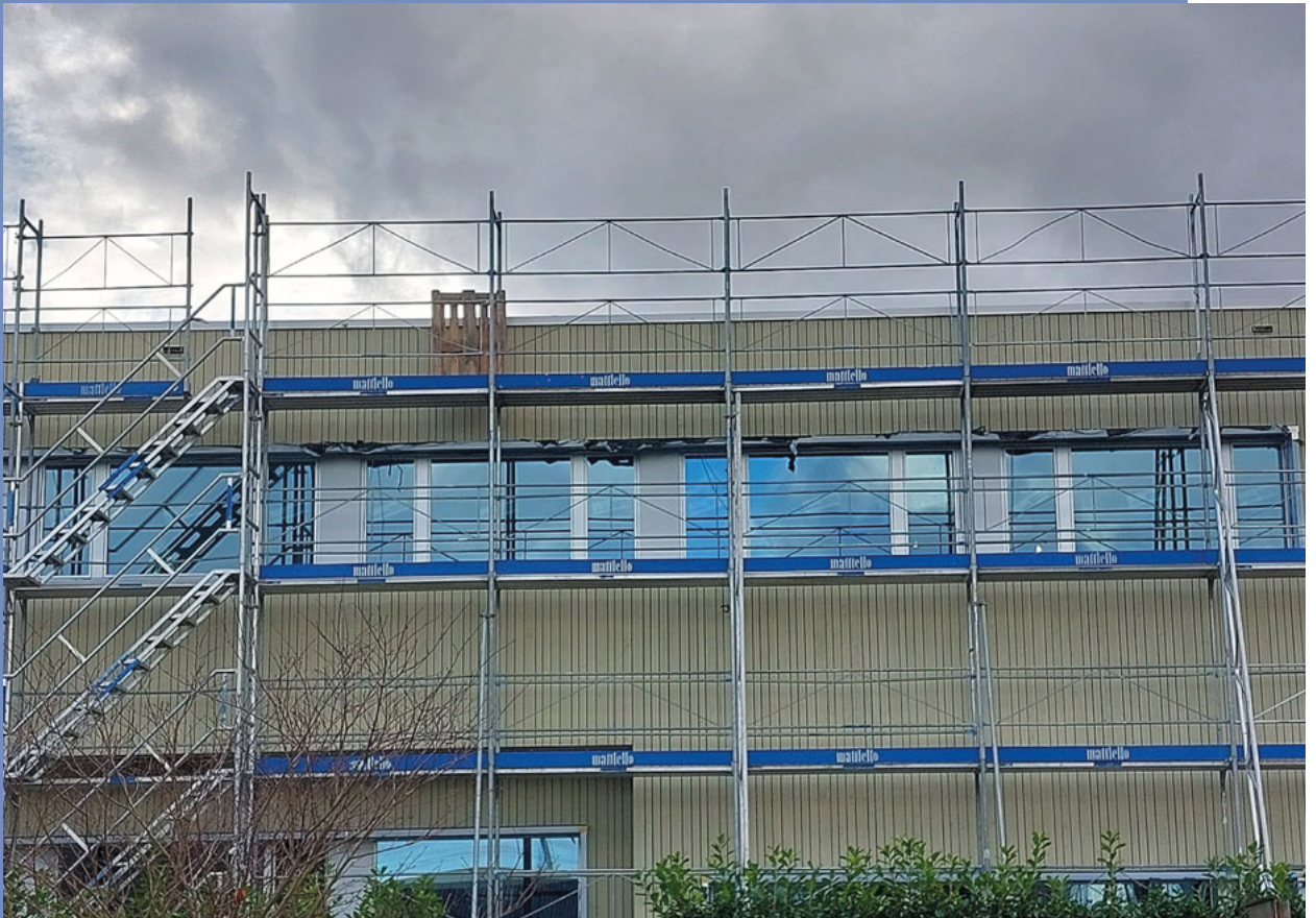
Ein lindengrüner Anstrich prägt die hinterlüftete Holzfassade des neuen Singsaals und Verwaltungsgebäudes