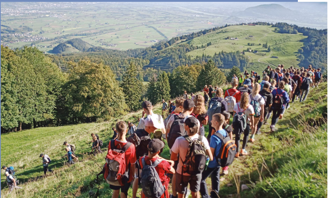
Alpha Rheintal Bank – Alpenchallenge Hoher Kasten