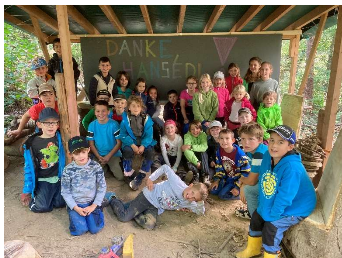
Waldschulzimmer PS Lienz