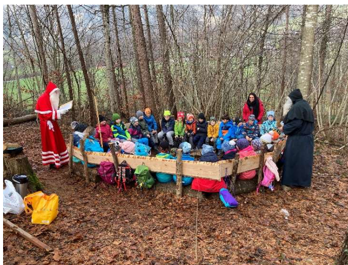
Samichlaus im Waldschulzimmer

Das Budget für Lehrmittel wurde erhöht, da mit der Schaffung der neuen Logopädiestelle auch ein kurzfristig erhöhter Bedarf an Lehrmitteln vorhanden ist.