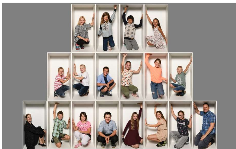
Milkyway Mehrklasse Zyklus 2