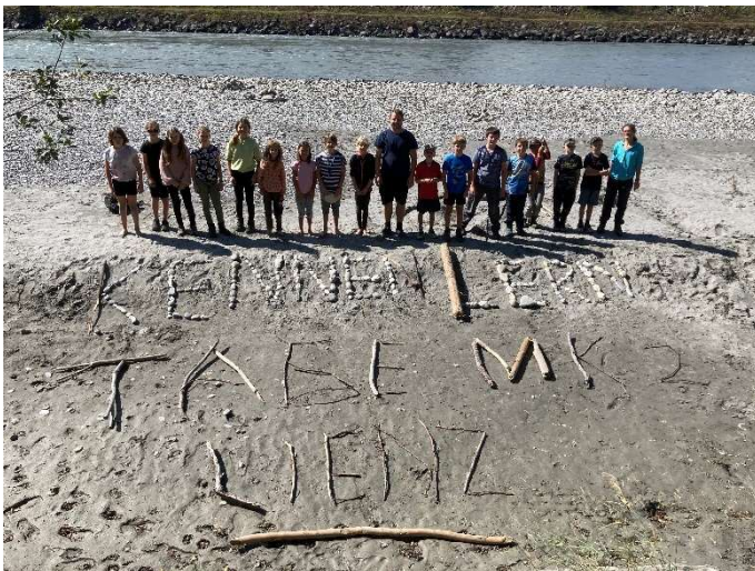
Kennenlerntage MK 2

Da die Verzinsung des Darlehens der Stadt Altstätten zur Zeit der Budgeterstellung noch unklar war, wurden die Verzinsungen zu hoch budgetiert.