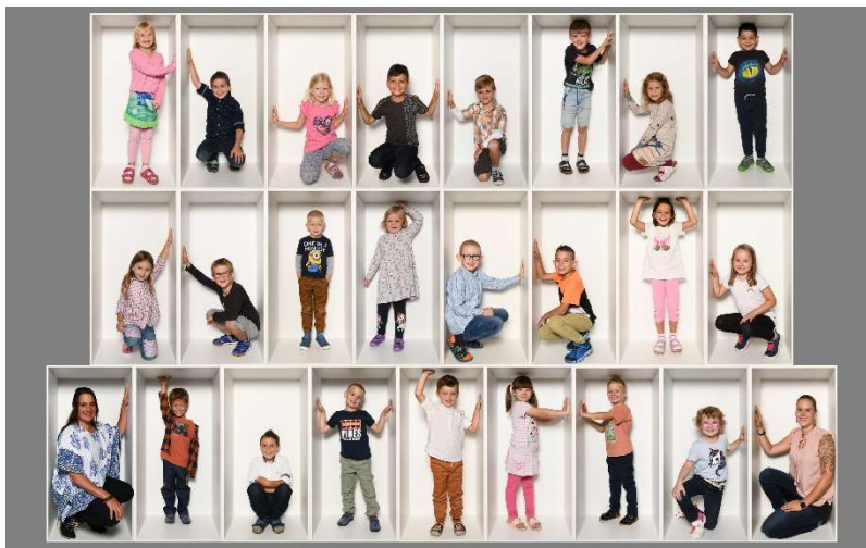
Sternschnuppe Mehrklasse Zyklus 1