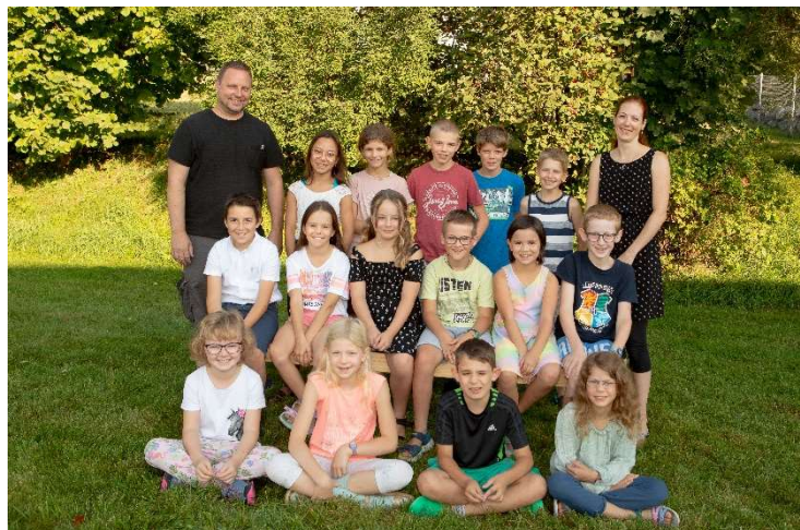
Milkyway Mehrklasse Zyklus 2