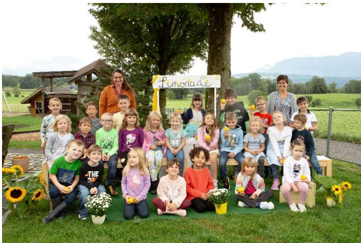
Sternschnuppe Mehrklasse Zyklus 1