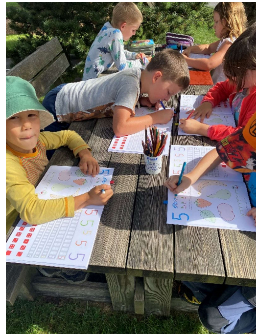
Unterricht im Freien

Viele Eltern haben entschieden, die obligatorischen Schuluntersuche beim Privatarzt zu machen, was zu einem Minderbedarf führte.