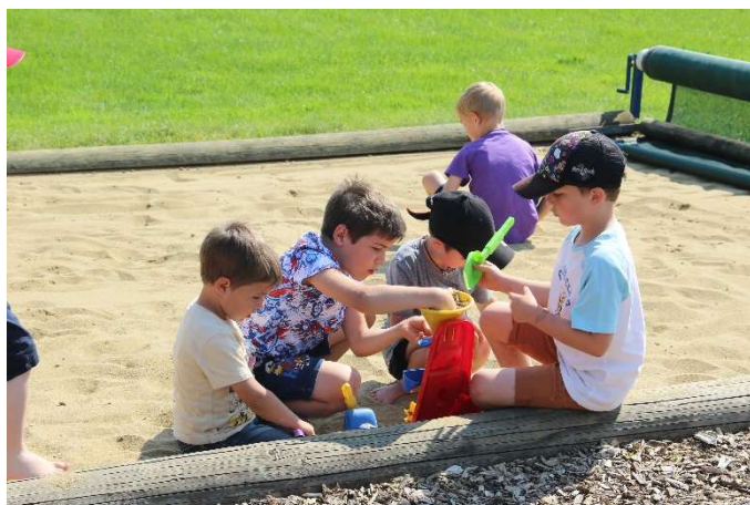
Rechnen mal anders