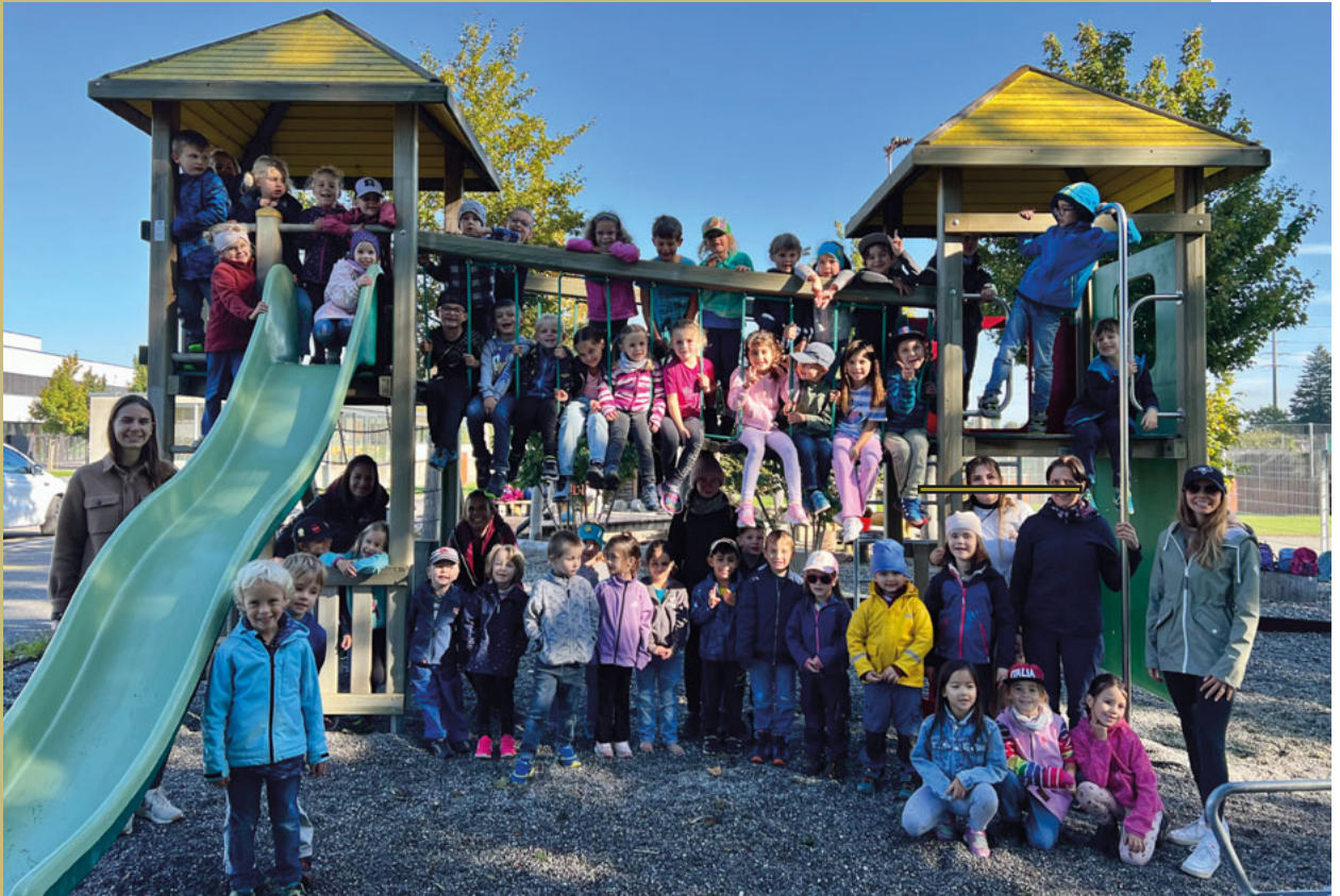
Herbstausflug Kindergarten, 1. & 2. Klasse Eichenwies zum Spielplatz bei der Badi Oberriet