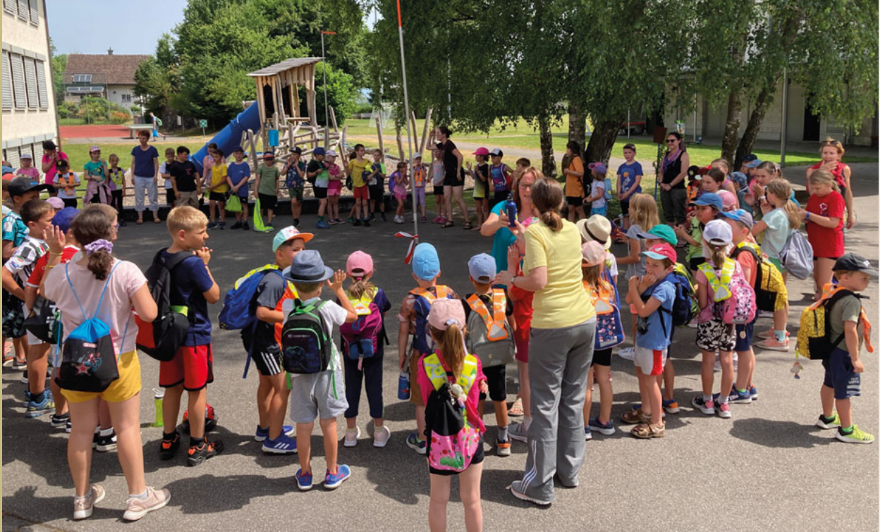
Sporttag 1. Zyklus Montlingen