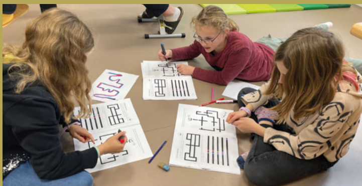
Karussell freies Spiel BasJ, 1. & 2. Klasse Oberriet

Die Rückerstattungen aus CO 2 -Abgaben werden höher erwartet.