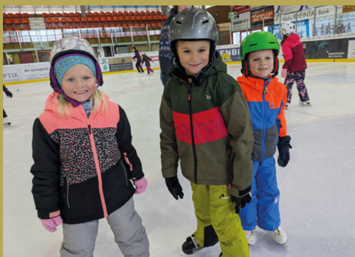
Eislaufen 1. – 3. Klasse & BasJ Oberriet