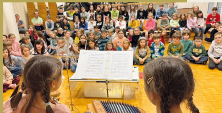
Weihnachtsanlass 1. - 6. Klasse Eichenwies