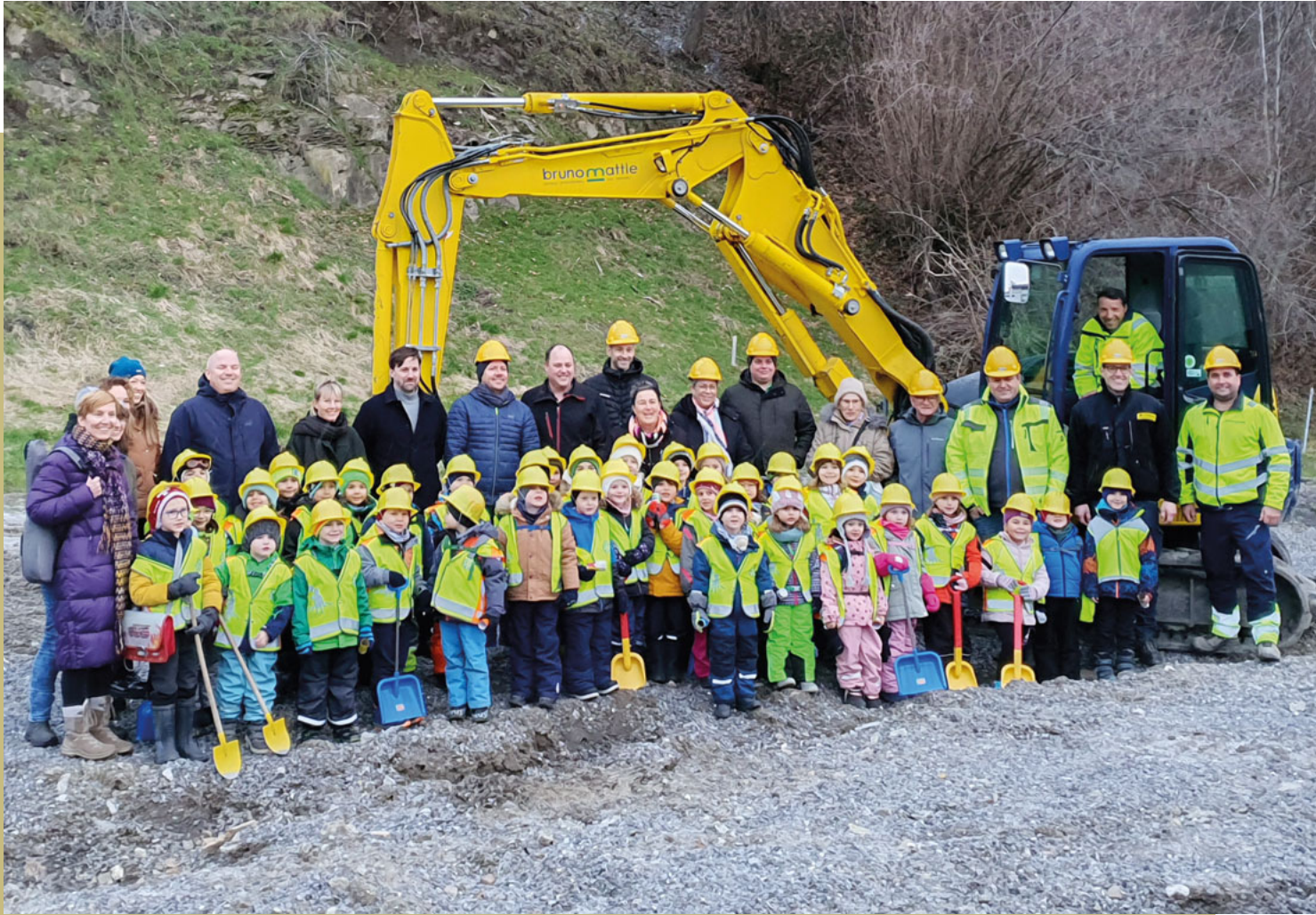
Spatenstich Kindi am Bärli