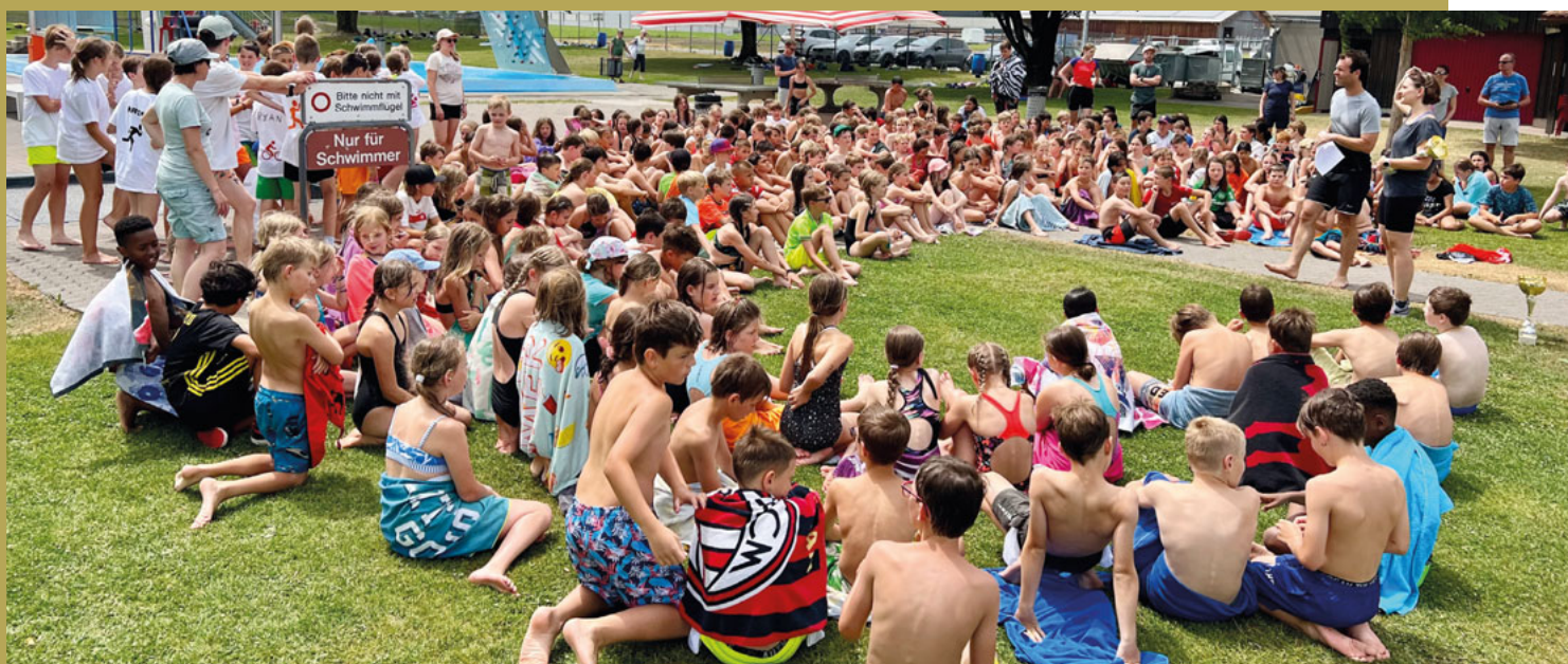
ekmo Cup 4.- 6. Klasse - Triathlon rund um die Badi Oberriet