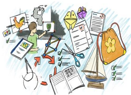
Vielfältige Leistungsnachweise →

Wie Ihr im Film gehört habt, wird sehr viel Wert auf vielfältige Leistungsnachweise gelegt (schriftliche & mündliche Überprüfungen, Prozessbewertungen, Produktbewertungen, ...). Rückmeldungen können in unterschiedlichen Formen an Euch und die Schüler*innen gelangen: Noten, Diagramme, Raster oder auch mündlich. Beobachtungen der Lehrpersonen fliessen auch ohne Elternrückmeldung in die Gesamtbeurteilung ein. Auf die Erweiterung unserer Methodenvielfalt bezogen auf Leistungsnachweise und Rückmeldungen an unsere Schüler*innen und an Euch liegt in der nächsten Zeit unser spezieller Fokus. Ausserdem werden wir uns mit dem ALSV vertieft auseinandersetzen.